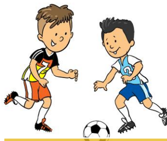
Journée avec les Centres de Loisir